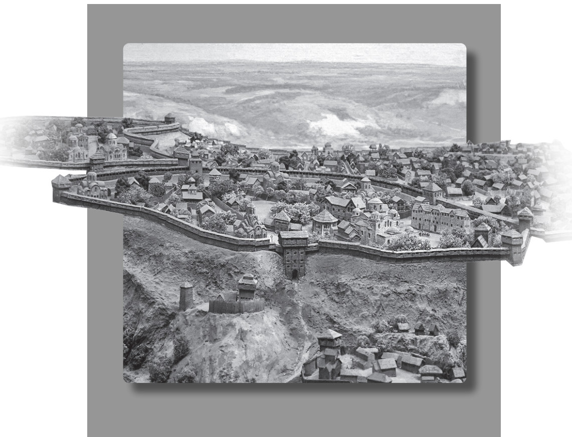
Макет Стародавнього Києва http://www.golos.com.ua/article/314096