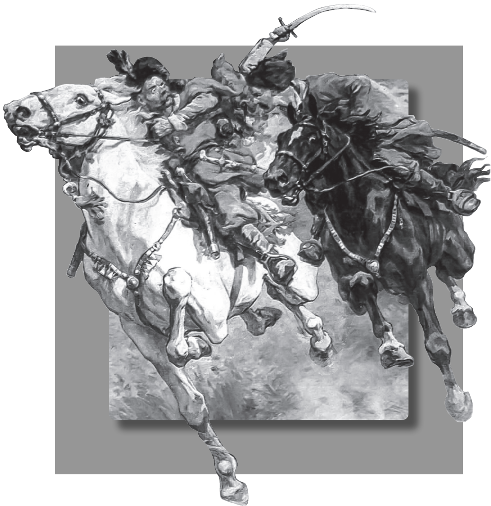
Бій Богуна з Чернецьким під Монастирищем у 1653 р. Фрагмент картини М. Самокиша https://commons.wikimedia.org/wiki/File:Bohun_vs_Czernecki_battle.jpg#/media/File:Bohun_vs_Czernecki_battle.jpg