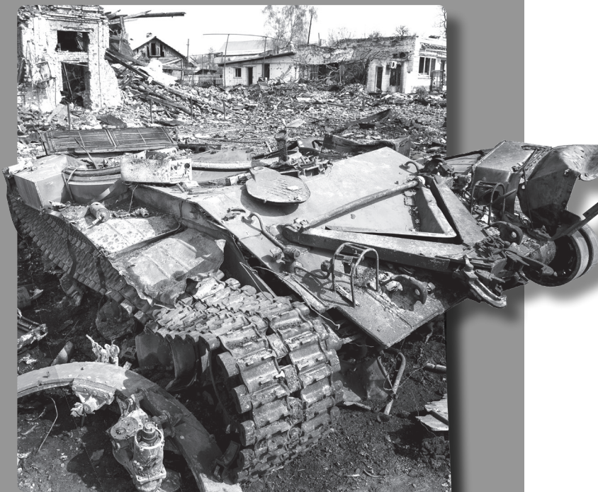
Знищений російській танк