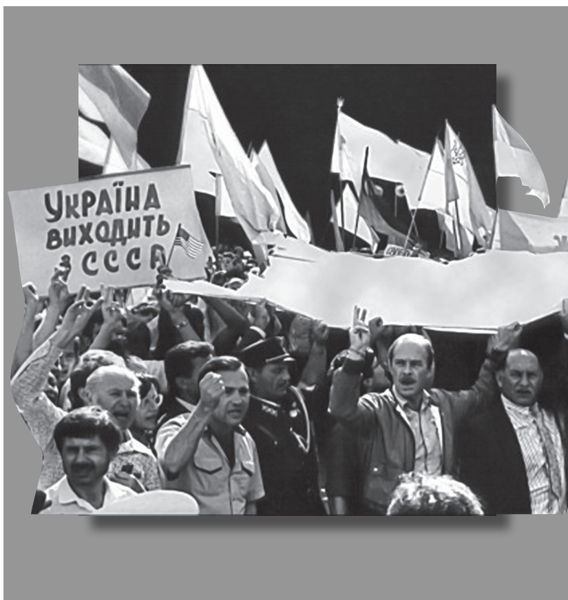
Мітинг на площі біля Верховної Ради України. Київ, 24 серпня 1991 р. https://uk.wikipedia.org/wiki/