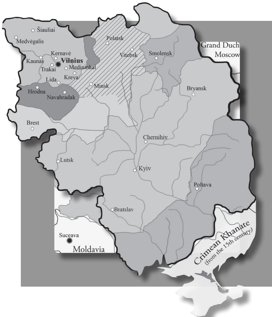
Експансія Литви на землі Русі https://commons.wikimedia.org/wiki/File:Lithuanian_state_in_13-15th_centuries.png#/media/Файл:Lithuanian_state_in_13-15th_centuries.png