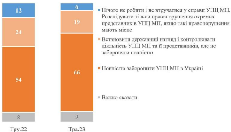
Рис. 6.1. Як Ви вважаєте, якою має бути зараз політика влади України щодо Української Православної Церкви Московського Патріархату (глава – Онуфрій)?