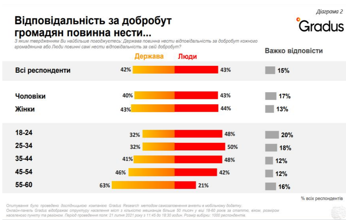
Рис. 2. «Відповідальність та добробут громадян повинна нести...». Діаграма. *

* Джерело: Україна майбутнього: дев'ять інсайтів. Gradus. Київ. Серпень 2021. С. 32. URL: https://gradus.app/documents/88/Gradus_Research_FutureUkraine_20082021.pdf